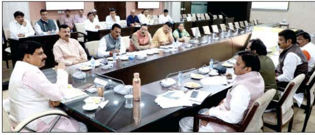
मुख्यमंत्री डॉ. मोहन यादव की अध्यक्षता में सिंहस्थ 2028 के लिए गठित मंत्रीमंडलीय समिति की बैठक हुई

भोपाल, प्रति 12 वर्ष में उज्जैन में होने वाला सिंहस्थ प्रदेश के साथ ही राष्ट्र के लिए एक महत्वपूर्ण आयोजन है। पूरे विश्व में इसकी गूंज होती है। सिंहस्थ के लिए राज्य सरकार तैयारियाँ शारंभ कर चुकी है। सिंहस्थ में आने वाले श्रद्धालुओं और पर्यटकों को अधिक से अधिक सुविधाएं देने के लिए अनेक नए निर्माण कार्य भी होंगे। यह बात मुख्यमंत्री डॉ. मोहन यादव ने सिंहस्थ 2028 के लिए गठित मंत्री-मंडलीय समिति के सदस्यों को संबोधित करते हुए कहा। मुख्यमंत्री ने कहा कि उज्जैन में ठहरने,