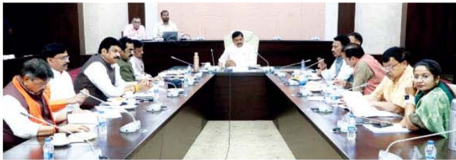
मुख्यमंत्री डॉ. मोहन यादव की अध्यक्षता में भोपाल में मंत्रिपरिषद की बैठक सम्पन्न हुई

भोपाल, मुख्यमंत्री डॉ. मोहन यादव की अध्यक्षता में मंत्रिपरिषद की बैठक मंत्रालय में हुई। मंत्रिपरिषद द्वारा 614 करोड़ 53 लाख रुपये से सेवरखेड़ी-सिलारखेड़ी परियोजना का निर्माण कराये जाने का निर्णय लिया गया। निर्णय अनुसार सिलारखेड़ी जलाशय की ऊंचाई बढ़ायी जाकर जलाशय की जल संग्रहण क्षमता में वृद्धि की जायेगी। परियोजना में संग्रहित जल से सिंधा नदी को निर्मल प्रवाहमान बनाये रखने तथा चित्तवद वृद्ध परियोजना में जल को संग्रहित किया जाकर लगभग 65 ग्रामों की 18 हजार 800 हेक्टेयर क्षेत्र में सिंचाई सुविधा उपलब्ध हो सकेगी।