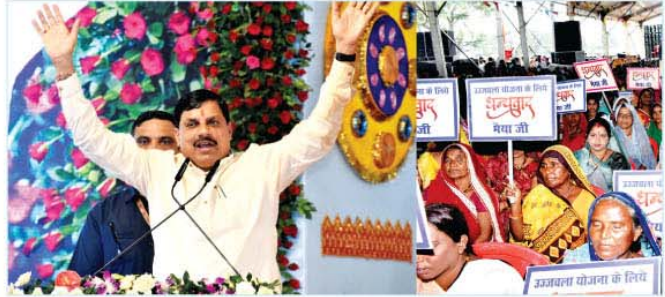
मुख्यमंत्री डॉ. मोहन यादव ने कटनी में आयोजित कार्यक्रम में स्थानीय लोगों को संबोधित किया

कटनी, भावान श्रीराम अपने 14 वर्ष के बच्चा के दौरान बहोरीबंद की पवन भूमि से होकर चित्रकूट गए थे। यह श्रीराम की तपोस्थली है। इस क्षेत्र की जनता को पिछले 40 वर्षों से जिस योजना का इंतजार था, वह आज पूरी होने जा रही है। यह बात मुख्यमंत्री डॉ. मोहन यादव ने कटनी जिले के बहोरीबंद में 1011.05 करोड़ रुपये की लागत की बहोरीबंद उद्वहन माइक्रो सिंचाई परियोजना के शुभारंभ अवसर पर संबोधित करते हुए कही।