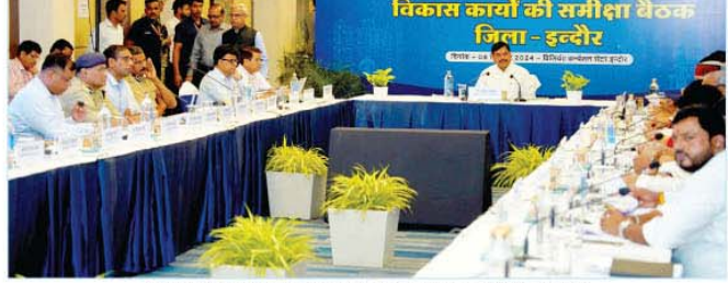
मुख्यमंत्री डॉ. मोहन यादव इंदौर में विकास कार्यों की समीक्षा बैठक को संबोधित करते हुए

इंदौर, इंदौर तेजी से बढ़ता हुआ शहर है। इस शहर में विकास की अपार संभावनाएं हैं। मध्यप्रदेश और इंदौर शहर देश के मध्य भाग में स्थित है। इसे दक्षिण दिखते हुए यहां का विकास सुनिश्चित रूप से किए जाने की आवश्यकता है। अगर इंदौर शहर और मध्यप्रदेश का सुनिश्चित विकास होगा तो इसका लाभ अन्य राज्यों को भी मिलेगा। यह बात मुख्यमंत्री डॉ. मोहन यादव ने इंदौर में विकास कार्यों की समीक्षा बैठक को संबोधित करते हुए कहा।