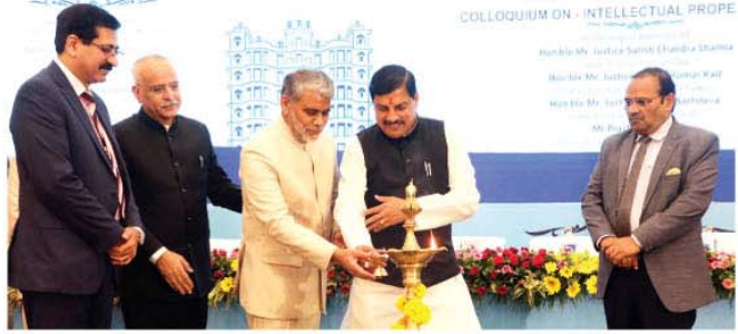
मुख्यमंत्री डॉ. मोहन यादव इंदौर में आयोजित बौद्धिक सम्पदा संगोष्ठी का वीप प्रज्वलित कर शुभारंभ करते हुये

इंदौर, इंदौर में आयोजित दो दिवसीय बौद्धिक सम्पदा संगोष्ठी में विचारों के अमृत मंथन से जो भी निष्कर्ष निकलेगा, उस निष्कर्ष पर मध्यप्रदेश सरकार व्यवस्था बनाने का कार्य करेगी। आने वाले समय में बौद्धिक सम्पदा कानून के संदर्भ में अनेक चुनौतियाँ हैं। ऐसे में उच्च न्यायालय द्वारा इस तरह की संगोष्ठी का आयोजन किया जाना एक सराहनीय पहल है। सर्वसुलभ और समदर्शी न्याय की सुलभता के लिए न्यायालिका से सम्बन्ध की कमी नहीं रहेगी। ये बातें मुख्यमंत्री डॉ. मोहन यादव