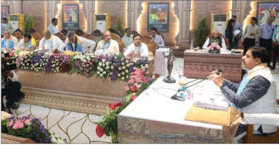
दमोह जिले के सिंग्रामपुर में मुख्यमंत्री डॉ. मोहन यादव ने मंत्रिपरिषद की बैठक को संबोधित किया

दमोह, मुख्यमंत्री डॉ. मोहन यादव की अध्यक्षता में दमोह जिले के सिंग्रामपुर में बीरगंगा रानी दुर्गावती के समान में मंत्रिपरिषद की बैठक हुई। मंत्रिपरिषद ने रानी दुर्गावती श्रीअन्न प्रोत्साहन योजना में अधिकतम 3900 रुपये प्रति हेक्टेयर अतिरिक्त सहायता राशि की स्वीकृति दी। मंत्रिपरिषद ने योजना वर्ष 2024-25 अंतर्गत गठित महासभा द्वारा प्राय कोदो-कुट्टी पर किसानों को भुगतान किये गये न्यूनतम क्रय मूल्य के अतिरिक्त यह सहायता राशि किसानों के खाते में दिये जाने का निर्णय लिया।