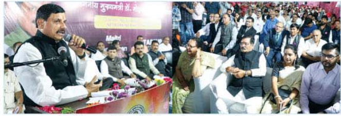
मुख्यमंत्री डॉ. मोहन यादव इंटीर में बुज मैत्री बिजनेस एक्सपो-2024 के शुभारंभ कार्यक्रम को संबोधित करते हुए

इंदौर, मुख्यमंत्री डॉ. मोहन यादव ने इंटीर में बुज मैत्री बिजनेस एक्सपो-2024 का दीप प्रज्वलित कर शुभारंभ किया गया। बुज मैत्री बिजनेस एक्सपो 2024 बिजनेस नेटवर्किंग इवेंट का आयोजन 28-29 सितंबर 2024 को अपने प्रथम श्रावण इंटीर में आयोजित किया गया। मुख्यमंत्री ने कहा है कि बुज मैत्री बिजनेस एक्सपो-2024 बिजनेस नेटवर्किंग इवेंट अपने आप में नवाचार के नैसर्गिक गुण को बढ़ाने और समाज के अन्य लोगों को प्रोत्साहित करने की दिशा में एक अच्छा प्रयास है। मुख्यमंत्री ने कहा कि समाज की सभी गतिविधियों के संचालन में व्यापारी वर्ग का महत्वपूर्ण योगदान है। उन्होंने प्रधानमंत्री श्री नरेन्द्र मोदी को धन्यवाद देते हुए कहा कि भारतीय अर्थव्यवस्था के विकास के लिये उनका दृष्टि और स्टार्ट-अप इंडिया जैसे प्रोग्राम से व्यापार की अर्थव्यवस्था अपने नए आयाम को छू रही है।