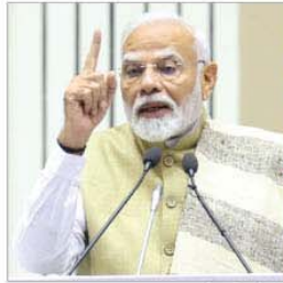
प्रधानमंत्री श्री नरेन्द्र मोदी ने नई दिल्ली में स्वच्छता ही सेवा-2024 कार्यक्रम को संबोधित किया

दो अक्टूबर के दिन, मैं कर्ताब्यबोध से भी बड़ा हुआ हूँ और उनका ही भावुक भी हूँ। स्वच्छ भारत मिशन की यात्रा 10 साल के मुकाम पर पहुंच चुकी है। स्वच्छ भारत मिशन की यह यात्रा, करोड़ों भारतवासियों की अटूट प्रतिबद्धता का प्रतीक है। बीते 10 साल में भारतीयों ने इस मिशन को अपनाया है, अपना मिशन बनाया है और इसे अपने जीवन का हिस्सा बनाया है। यह बात प्रधानमंत्री श्री नरेन्द्र मोदी ने नई दिल्ली में आयोजित स्वच्छता ही सेवा-2024 कार्यक्रम को संबोधित करते हुए कही। प्रधानमंत्री ने कहा कि 10 साल की इस यात्रा के पड़ाव पर, हर देवासी, हमारे सफाई मित्र, हमारे धर्मगुरु, हमारे खिलाड़ी, हमारे सेलिब्रिटी, एमसीओ और मीडिया के साथियों, सभी ने मिलकर स्वच्छ भारत मिशन को इतना बड़ा जन-आंदोलन बना दिया। स्वच्छता ही सेवा पखवाड़ के 15 दिनों में देशभर में 27 लाख से ज्यादा कार्यक्रम हुए, जिनमें 28 करोड़ से ज्यादा लोगों ने हिस्सा लिया। निरंतर प्रयास करके