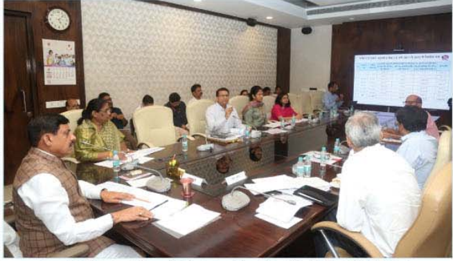
मुख्यमंत्री डॉ. मोहन यादव ने मंत्रालय में महिला एवं बाल विकास विभाग की समीक्षा बैठक को संबोधित किया

भोपाल, मुख्यमंत्री डॉ. मोहन यादव की अध्यक्षता में मंत्रालय में महिला एवं बाल विकास विभाग के कार्यों और योजनाओं की समीक्षा बैठक संपन्न हुई। इस अवसर पर महिला एवं बाल विकास मंत्री सुश्री निर्मला भूरिया भी उपस्थित थीं। बैठक में मुख्यमंत्री ने निर्देश दिए कि लाइली बहनों को लघु उद्योग और व्यवसाय की गतिविधियों से जोड़ा जाए। हुनरमंद लाइली बहनों को चिह्नित कर लघु उद्योगों से जोड़ा जाएगा तो उनके आर्थिक उत्थन का मार्ग प्रशस्त होगा। हितग्राही बहनों को यह लाभ दिलाया जाए। मुख्यमंत्री ने कहा कि प्रदेश में आंगनवाड़ी केंद्रों के निर्माण कार्य में सीएसआर फंड का उपयोग किया जाए। आंगनवाड़ी केंद्रों को व्यवस्थित और सुविधाजनक बनाने के लिए प्राण ज्ञान सहयोग्य सराहनीय है। बैठक में जनजातीय बहुल क्षेत्र में आंगनवाड़ी केंद्रों को अधिक प्रभावी बनाने के संबंध में भी चर्चा हुई। प्रदेश में 97 हजार 339 आंगनवाड़ी केंद्रों का संचालन किया जा रहा है। इनसे 81 लाख महिलाएं और बच्चे लाभान्वित हो रहे हैं। मुख्यमंत्री ने मिशन वास्तव्य सहित विभिन्न कार्यक्रम की सतत मॉनिटरिंग के निर्देश दिए।