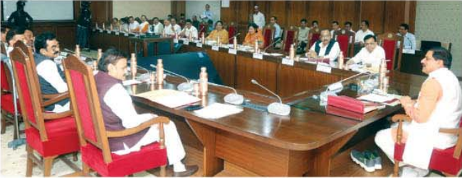
मुख्यमंत्री डॉ. मोहन यादव ने मंत्रालय में आयोजित मंत्रिपरिषद की बैठक को संबोधित किया

भोपाल, मुख्यमंत्री डॉ. मोहन यादव की अध्यक्षता में मंत्रिपरिषद की बैठक मंत्रालय में हुई। मंत्रिपरिषद द्वारा प्रदेश में वर्तमान में संचालित 12 हजार 670 मिनी आंगनवाड़ी केन्द्रों को पूर्ण आंगनवाड़ी केन्द्र में उन्नयन किये जाने का निर्णय लिया गया। उल्लेखनीय है कि मिनी आंगनवाड़ी केन्द्रों में एक आंगनवाड़ी कार्यकर्ता का प्रबंधन है। निर्णय अनुसार इन मिनी आंगनवाड़ी केन्द्रों के उन्नयन के बाद एक पद आंगनवाड़ी कार्यकर्ता एवं एक पद आंगनवाड़ी सहायिका का होगा। उन्नयित 25 आंगनवाड़ी केन्द्रों पर एक परिवेक्षक के मान से कुल 476 परिवेक्षक के पद स्वीकृत किये गये। केन्द्र सरकार के निर्धारित मापदण्ड उन्नयित आंगनवाड़ी केन्द्रों पर लागू होंगे।