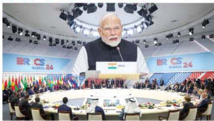
प्रधानमंत्री श्री नरेंद्र मोदी 16वें ब्रिक्स शिखर सम्मेलन में अपनी बात रखते हुए

प्रधानमंत्री श्री नरेंद्र मोदी रूस की अध्यक्षता में संपन्न 16वें ब्रिक्स शिखर सम्मेलन में सम्मिलित हुए कबान में प्रधानमंत्री श्री नरेंद्र मोदी ने ब्रिक्स नेताओं से बहुपक्षवाद को मजबूत करने, आतंकवाद का मुकाबला करने, आर्थिक विकास को बढ़ावा देने और ग्लोबल साउथ की चिंताओं पर ध्यान केंद्रित करने सहित कई मुद्दों पर सकारात्मक चर्चा की। इस दौरान सभी ब्रिक्स देशों के नेताओं ने 13 नए ब्रिक्स भागीदार देशों का स्वागत किया। प्रधानमंत्री ने ब्रिक्स शिखर सम्मेलन के दो सत्रों को संघोषित करने की प्रशंसा की।