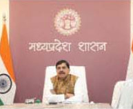
कही। मुख्यमंत्री ने 11 विभागों की समीक्षा की और विभिन्न 10 भाग में स्व-रोजगार और रोज़गार सृजन के प्रयासों की समीक्षा के साथ आगामी 4 वर्षों में रोज़गार सृजन के लिए कार्य-योजना पर चर्चा की।

भोपाल, प्रदेश के युवाओं को उनकी योग्यता के अनुरूप स्वरोजगार और रोज़गार देने के लिये सरकार प्रतिबद्ध है। युवाओं में रोज़गार और स्वरोजगार के लिए कोशलता का विकास किया जाना आवश्यक है। प्रदेश के उद्योगों में रोज़गार की मांग, आवश्यक कौशल विकास, शासकीय योजनाओं की जानकारी और प्रशिक्षण को एक प्लेटफॉर्म पर लाने के लिए रोज़गार प्रदान करने वाले सभी विभागों का इन्टीग्रेटेड रोज़गार स्पेक्ट पोर्टल तैयार करें। यह बात मुख्यमंत्री डॉ. मोहन यादव ने रोज़गार और स्वरोजगार के संबंध में आयोजित समीक्षा बैठक के दौरान