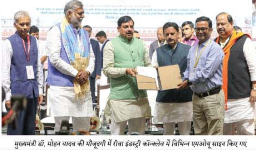
मुख्यमंत्री डॉ. मोहन यादव की मौजूदगी में रीवा इंडस्ट्री कॉन्क्लेव में विभिन्न एमओयू साइन किए गए

रीवा, प्रदेश में श्रृंखलाबद्ध आयोजित की जा रही रीजनल इंडस्ट्री कॉन्क्लेव प्रदेश के विकास का पथ है। इसमें शामिल हो रहे उद्योगपतियों और निवेशकों के सहयोग से उपलब्ध संसाधनों का बेहतर उपयोग कर प्रदेश को हीर की तरह तारारंगीं सभी क्षेत्रों में विकास की संभावनाओं के दृष्टिगत नये उद्योगों की स्थापना के साथ प्रत्येक को रोज़गार उपलब्ध कराना प्रतिबद्धता भी है और पौषित संकल्प भी। यह बात मुख्यमंत्री डॉ. मोहन यादव ने रीवा में आयोजित वाइब्रेंट विंध्य रीजनल