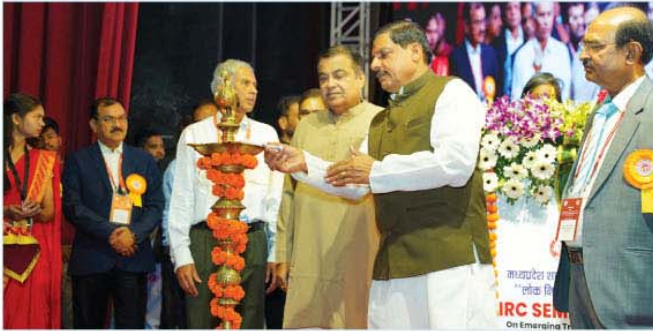
मुख्यमंत्री डॉ. मोहन यादव और केंद्रीय सड़क एवं परिवहन मंत्री श्री नितिन गडकरी ने कार्यान्वयन का शुभारंभ किया

भोपाल, मुख्यमंत्री डॉ. मोहन यादव ने वीरन्त भवन में लोक निर्माण विभाग मध्यप्रदेश और इंडियन रोड कार्पोरेशन नई दिल्ली के संयुक्त तत्वावधान में 'सड़क और पुल निर्माण में उभरती नवीनतम प्रवृत्तियों और तकनीकों' पर केंद्रित दो दिवसीय सेमिनार को संबोधित किया। मुख्यमंत्री ने कहा कि सड़कों तथा अधोसंरचना के निर्माण में प्रयुक्त हो रही नवीन तकनीक और विधाओं पर विचार-विमर्श के दौरान प्राचीनकाल में हुए निर्माण कार्यों में प्रयुक्त प्रभावी तकनीक पर गौर करना तथा उनसे प्रेरणा लेना भी आवश्यक है। राजा भोज द्वारा एक हजार साल पहले बनाया गया भोपाल का बड़ा ताल मितव्ययता के साथ प्रभावी जल प्रबंधन का अनूठा उदाहरण है। सम्राट अशोक और सम्राट विक्रमादित्य के काल के सिक्कों पर बने मांगों के चिह्न उस काल में सड़कों की महत्ता को दर्शाते हैं। यह तथ्य बताते हैं कि जब