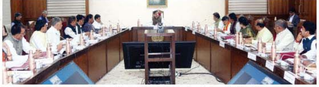
मुख्यमंत्री डॉ. मोहन यादव ने मंत्रालय में आयोजित मंत्रिपरिषद की बैठक को संबोधित किया

भोपाल, मुख्यमंत्री डॉ. मोहन यादव की अध्यक्षता में मंत्रिपरिषद की बैठक मंत्रालय में हुई। मंत्रिपरिषद द्वारा मध्यप्रदेश में भगवान श्रीकृष्ण से संबंधित स्थानों को तीर्थ के रूप में विकसित करने के उद्देश्य से मध्यप्रदेश लोक न्यास अधिनियम 1951 के अंतर्गत 'श्रीकृष्ण पाथेय न्यास' का गठन किए जाने की स्वीकृति प्रदान की गयी। स्वीकृति अनुसार भगवान श्रीकृष्ण से संबंध क्षेत्रों का साहित्यिक एवं सांस्कृतिक संरक्षण और संवर्धन किया जायेगा। न्यास द्वारा भगवान श्रीकृष्ण के मंदिरों एवं संरचनाओं का प्रबंधन, सांदीपनि गुरुकुल की स्थापना के लिए परामर्श, सुझाव, श्रीकृष्ण पाथेय के स्थानों का सामाजिक, आर्थिक तथा पर्यटन की दृष्टि से विकास, पुस्तकालय, संग्रहालय की स्थापना आदि गतिविधियों का क्रियान्वयन किया जा सकेगा। मुख्यमंत्री की अध्यक्षता में गठित न्यास में कुल 28 सदस्य होंगे। इसमें 23 पदेन न्यासी सदस्य तथा 5 ख्याति प्राप्त विद्वत् सदस्य, अशासकीय न्यासी सदस्य के रूप में नामांकित होंगे। अशासकीय न्यासी सदस्यों का कार्यकाल अधिकतम 3 वर्ष होगा।