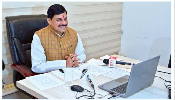
मुख्यमंत्री डॉ. मोहन यादव ने देवास में आयोजित भूमिपूजन समारोह को वरुअली संबोधित किया

भोपाल, मुख्यमंत्री डॉ. मोहन यादव ने कुशाभाऊ ठाकरे स्टेडियम देवास में सिंथेटिक एथलेटिक ट्रैक के भूमिपूजन कार्यक्रम को नई दिल्ली से वरुअली संबोधित किया। मुख्यमंत्री ने कहा कि प्रदेश में खेल अधोसंरचना का निरंतर विकास हो रहा है। प्रधानमंत्री श्री नरेन्द्र मोदी के मार्गदर्शन में इस दिशा में जिस प्रकार कार्य जारी है, उससे प्रदेश के खिलाड़ी विक्रम अर्बोर्ड प्राप्त करने के साथ-साथ एशियाड और ओलंपिक में अर्बोर्ड प्राप्त करने की ओर भी अग्रसर हो रहे हैं। देवास में कुशाभाऊ ठाकरे स्टेडियम और श्रीमंत तुकोजीराव पवार स्टेडियम से कई प्रतिभाजन खिलाड़ी प्रदेश एवं देश को मिलेंगे। श्रीमंत तुकोजीराव पवार की जयंती पर देवास को मिल रही सिंथेटिक एथलेटिक