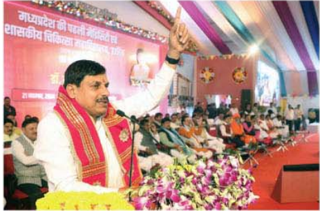
मुख्यमंत्री डॉ. मोहन यादव ने उज्जैन में आयोजित भूमिपूजन समारोह को संबोधित किया

उज्जैन, प्रधानमंत्री श्री नरेन्द्र मोदी ने मध्यप्रदेश के उज्जैन को मेडिसिटी एवं चिकित्सा महाविद्यालय की सीढ़ी तैयार की है। सिंहस्थ के पहले यह महत्वाकांक्षी प्राइवेट तैयार हो जायेगा। इस नवीन व्यवस्था से महाकाल की गिरगनी में अब हर बीमारी का इलाज होगा। आने वाले समय में उज्जैन की मेडिसिटी दुनियाभर में पहचानी जायेगी। यह बात मुख्यमंत्री डॉ. मोहन यादव ने उज्जैन में मेडिसिटी एवं चिकित्सा महाविद्यालय के भूमि पूजन समारोह को संबोधित करते हुए कही। मुख्यमंत्री ने कहा कि उज्जैन में हाईटेक स्वास्थ्य सुविधाओं के साथ मेडिकल डिवाइस पार्क भी विकसित होगा। एक ही परिसर में सारी सुविधाएं उपलब्ध करने के उद्देश्य से हाईस्पाइज बिल्डिंग बनाई जायेगी तथा एक-एक इंच भूमि का उपयोग किया जायेगा और चिकित्सकों एवं पैरामेडिकल स्टाफ आदि के लिए आवासीय व्यवस्था रहेगी। मुख्यमंत्री ने कहा कि वर्ष 2003-04 तक प्रदेश में कुल पांच मेडिकल