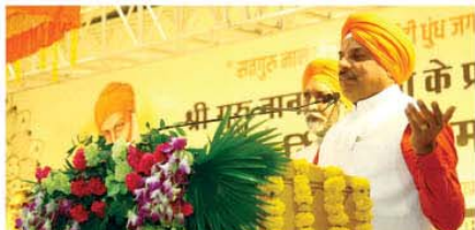
मुख्यमंत्री डॉ. मोहन यादव ने प्रकाश पर्व कार्यक्रम को संबोधित किया

भोपाल, मुख्यमंत्री डॉ. मोहन यादव के आग्रह पर श्री गुरु नानक जी के 555वें प्रकाश पर्व पर मुख्यमंत्री निवास में श्री गुरुदास साहब जी का भव्य दर्बारा सजाया गया और लोण की व्यवस्था की गई। मुख्यमंत्री डॉ. यादव के पगड़ी धारण कर दर्बारा में प्रवेश करते ही सभी उपस्थित बन ने 'जो बोले सो निहाल-सत श्री अकाल' के पद्य के साथ पुष्प वर्षा कर उनका स्वागत किया।