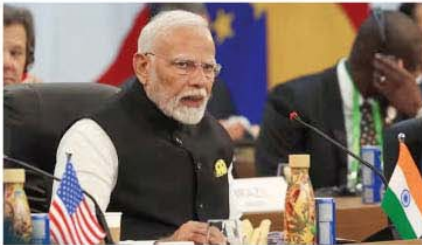
प्रधानमंत्री श्री नरेन्द्र मोदी ने ब्राजील में जी-20 शिखर सम्मेलन को संबोधित किया

प्रधानमंत्री श्री नरेन्द्र मोदी ने ब्राजील में हुए जी-20 शिखर सम्मेलन में दो महत्वपूर्ण सत्रों को संबोधित किया। प्रधानमंत्री ने सतत विकास और ऊर्जा परिवर्तन सत्र को संबोधित करते हुए कहा कि नई दिल्ली जी-20 शिखर सम्मेलन के दौरान समूह ने वर्ष 2030 तक अक्षय ऊर्जा क्षमता को तीन गुना और ऊर्जा दक्षता दर को दोगुना करने का संकल्प लिया था। प्रधानमंत्री ने सतत विकास प्राथमिकताओं को आगे बढ़ाने के