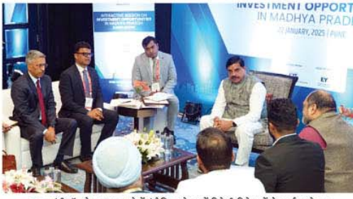
मुख्यमंत्री डॉ. मोहन यादव पुणे में इंटरैक्टिव सेशन में विदेशी निवेशकों से चर्चा करते हुए

पुणे, प्रदेश में वर्ष-2025 को उद्योग एवं रोजगार वर्ष घोषित किया गया है। औद्योगिक विकास की गति को तेज कर प्रदेश को आर्थिक रूप से अधिक उन्नत और समृद्ध बनाने के उद्देश्य से निवेश-अनुकूल नीतियों, उत्कृष्ट बुनियादी ढांचे