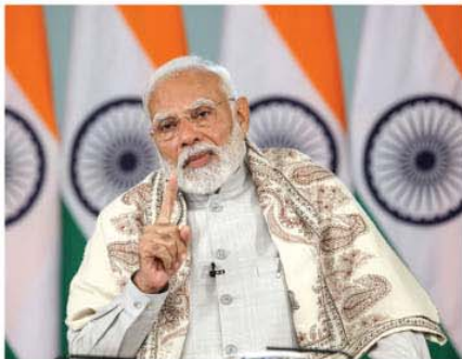
प्रधानमंत्री श्री नरेन्द्र मोदी संपत्ति कार्ड वितरण कार्यक्रम को संबोधित हुए

अमेरिका के राष्ट्रपति डोनाल्ड ट्रंप ने अमेरिका को विश्व स्वास्थ्य संगठन (डब्ल्यूएचओ) से अलग करने का ऐलान कर दिया है। ये फैसला उनके अमेरिका फर्स्ट एजेंडे का हिस्सा है। जहां उन्होंने कहा कि डब्ल्यूएचओ अमेरिका के हितों के खिलाफ काम कर रहा है। इसके साथ ही ट्रंप प्रशासन ने 90 दिनों के लिए विदेशी सहायता पर भी ठेक लगा दी है। इन कड़े कदमों से अंतर्राष्ट्रीय संगठनों और दुनिया भर में अमेरिकी कूटनीति पर बड़ा असर पड़ सकता है। ट्रंप ने डब्ल्यूएचओ पर कोविड-19 महामारी के दौरान गलत प्रबंधन और चीन के प्रभाव में काम करने का आरोप लगाया