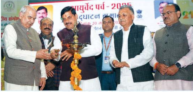
मुख्यमंत्री डॉ. मोहन यादव 21वें आयुर्वेद पर्व-2025 के अंतर्गत राष्ट्रीय सेमिनार का उद्घाटन करते हुए

आयुर्वेदिक कॉलेज आरंभ किए जाएंगे। नई शिक्षा नीति के प्रावधान अनुसार विश्वविद्यालयों को आयुर्वेदिक, मेडिकल