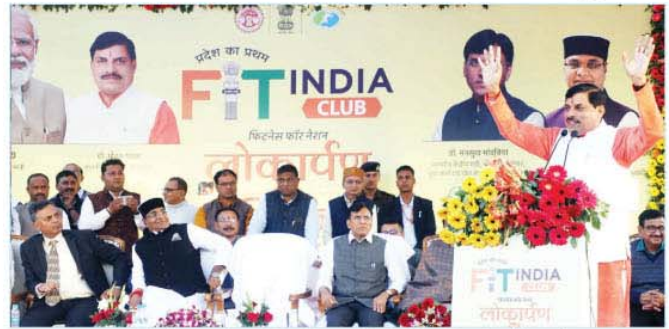
मुख्यमंत्री डॉ. मोहन यादव भोपाल में फिट इंडिया क्लब के लोकार्पण कार्यक्रम को संबोधित करते हुए

भोपाल, मुख्यमंत्री डॉ. मोहन यादव ने गौतम नगर में फिट इंडिया क्लब के प्रथम चरण का लोकार्पण एवं दूसरे चरण के भूमिपूजन कार्यक्रम को संबोधित किया। मुख्यमंत्री ने कहा कि हम खेल और खिलाड़ियों के समर्थन के लिए कटिबद्ध होकर प्रयास कर रहे हैं। हम सच्ची खेल भावना के साथ इस दिशा में आगे बढ़ रहे हैं। फिट इंडिया मूवमेंट के तहत प्रदेश के पहले फिट इंडिया क्लब की शुरुआत हुई। उन्होंने कहा कि यह पहल प्रधानमंत्री श्री नरेन्द्र मोदी के फिटनेस और स्वास्थ्य को लेकर विजन का एक अहम हिस्सा है। फिट इंडिया क्लब बनाने की बात अब पूरे प्रदेश में सकारात्मक रूप से गांव-गांव तक जाएगी। इससे बच्चे और बुजुर्ग सभी अपने स्वास्थ्य के प्रति जागरूक होंगे।