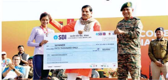
मुख्यमंत्री डॉ. मोहन यादव आर्मी मैराथन कार्यक्रम में विजेता प्रतिभागियों को पुरस्कृत करते हुए

भोपाल, मुख्यमंत्री डॉ. मोहन यादव ने द्रोणाचल में आयोजित आर्मी मैराथन कार्यक्रम को संबोधित किया। मुख्यमंत्री ने कहा कि पूरे देश और दुनिया को भारतीय सेना पर गर्व है। बेहद अनुशासित इकाई के रूप में सेना ने अपनी विशेष पहचान बनाई है। अपनी क्षमता और योग्यता से दुनिया की कई चुनौतियों का समाधान कर भारतीय सेना ने कठिनमय समय में अपनी उपस्थिति दर्ज कराई। देश को आजादी मिलने के समय, विघ्न के कई देश स्वतंत्र हुए लेकिन भारत आज विघ्न के सबसे बड़े लोकतंत्र के रूप में स्थापित है, इस पर सभी भारतवासियों को गर्व है। भारतीय सेना का अनुशासन, सबकता, स्फूर्ति और तत्परता ही इस गौरव का आधार है। साहस और शक्ति से संपन्न भारतीय सेना ने हर राजनीतिक परिस्थिति में अपनी सीमा और अनुशासन में रहते हुए