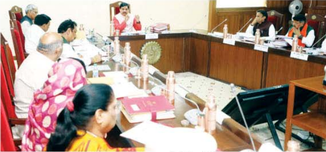
मुख्यमंत्री डॉ. मोहन यादव की अध्यक्षता में मंत्रिपरिषद की बैठक सम्पन्न हुई।

भोपाल, मुख्यमंत्री डॉ. मोहन यादव की अध्यक्षता में मंत्रिपरिषद की बैठक सम्पन्न हुई। मंत्रिपरिषद द्वारा प्रधानमंत्री आवास योजना-शहरी 2.0 के प्रदेश में क्रियान्वयन करने की स्वीकृति दी गई। योजना अनुसार प्रदेश के आर्थिक रूप से कमजोर, निम्न तथा मध्यम आय वर्ग के पात्र हितग्राही परिवारों को योजना के चार घटकों के माध्यम से लाभान्वित करने के लिए 5 वर्षों की योजना अवधि में 10 लाख आवासों के निर्माण में 50 हजार करोड़ रुपये व्यय होंगे। बेनिफिशियरी लेड कंस्ट्रक्शन (बी.एल.सी.) घटक अंतर्गत ईडब्ल्यूएस वर्ग के पात्र हितग्राही को स्वयं की भूमि पर आवास का निर्माण करने के लिए अनुदान प्रदान किया जायेगा। एफोडेबल हाउसिंग इन पार्टनरशिप (ए.एच.पी.) घटक अंतर्गत ईडब्ल्यूएस वर्ग के पात्र हितग्राहियों को नगरीय निधियों, राज्य की अन्य निर्माण पूर्णियों तथा निजी बिजनेस और डेवलपर के द्वारा आवासों का निर्माण कर प्रदान किया जायेगा। इस घटक अंतर्गत निजी डेवलपर द्वारा क्रियान्वित व्हाइट लिस्टेड एवं ओपन मार्केट परियोजनाओं में हितग्राहियों द्वारा आवास क्रय करने के लिए रेट्रोमिबल