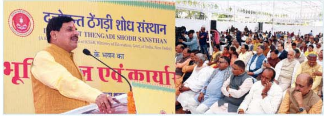
मुख्यमंत्री डॉ. मोहन यादव ने दत्तोपंत ठेंगडी संस्थान के भूमिपूजन कार्यक्रम में

भोपाल, मुख्यमंत्री डॉ. मोहन यादव ने दत्तोपंत ठेंगडी शोध संस्थान के नवीन परिसर भवन के भूमिपूजन और कार्य आरंभ के अवसर पर श्रोताओं को संबोधित किया। मुख्यमंत्री ने कहा कि ऋषि स्वरूप व्यक्तित्व के श्री दत्तोपंत ठेंगडी ने दीर्घक के समान स्वयं जनक विचारों का प्रकाश समाज को प्रदान किया। क्षेत्र, श्रमिकों की स्थिति और स्वदेशी की कृषि में उनका विचार उज्ज्वल नभर के समान हैं, जो समाज को निरंतर मार्गदर्शन प्रदान करते रहेंगे। विद्यार्थी परिषद के संस्थापक सदस्य के रूप में भी उनकी भूमिका महत्वपूर्ण रही है। हिंदुत्व को राष्ट्रीयता से आगे विश्व बंधुत्व के रूप में देखते थे। उनका मानना था कि चरित्र जगत में हिंदुत्व के विचार का विस्तार मनुष्य, समाज, राष्ट्र और मानवता तक है। वर्तमान समय में उनके विचार अधिक समसामयिक हो जाते हैं, समूर्ण विश्व विभिन्न समस्याओं में मार्गदर्शन और उनके समाधान के लिए भारत की ओर आशा की दृष्टि से देख रहा है। भारत अपनी यह भूमिका प्राचीन भारतीय ज्ञान परम्परा के आधार पर ही निभा सकता है। इस परिप्रेक्ष्य में भारतीय ज्ञान परम्परा के विभिन्न आयामों पर शोध