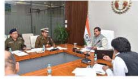
मुख्यमंत्री डॉ. मोहन यादव ने समलभ भवन (मुख्यमंत्री निवास) में जेल विभाग के कार्यों की समीक्षा की आधार या एक-तिहाई अवधि पूर्ण होने पर, ऐसे व्यक्ति को जमानत पर निर्मुक्त करने संबंधित मानवीय न्यायालय को कार्रवाई करने के लिए तुरंत लिखित में आवेदन करना।

भोपाल, गरीब बंदियों को जमानत एवं जुर्माना अदा करने के लिए वित्तीय सहायता प्रदान करने में मध्यप्रदेश देश में प्रथम है। इसमें आर्थिक रूप से कमजोर बंदियों को 25 हजार रुपये तक की जुर्माना राशि मंजूरी की जाती है। मध्यप्रदेश देश का पहला राज्य है जिसने अब तक 31 बंदियों को जुर्माना एवं जमानत के रूप में 6 लाख 43 लाख 517 रुपये की राशि मंजूरी की है। यह बात मुख्यमंत्री डॉ. मोहन यादव ने समलभ भवन में जेल एवं सुधारालय सेवा विभाग की समीक्षा बैठक को निर्देशित करते हुये कही। मुख्यमंत्री ने कहा कि भारतीय नागरिक सुरक्षा संहिता की धारा 479 के प्राधान्यों का पालन करने में भी मध्यप्रदेश देश में अग्रणी राज्य है। इस धारा में यह प्राधान्य है कि "जेल अधीक्षक, जेल में निरूद्ध अभियुक्त व्यक्ति के उपबंधित कारावासी की