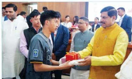
मुख्यमंत्री डॉ. मोहन यादव ने भोपाल में पूर्वोत्तर के छात्रों का स्वागत किया

मुख्यमंत्री ने कहा कि केंद्रीय बजट-2025 में घोषित 5 राष्ट्रीय कौशल उत्कृष्टता केंद्रों की स्थापना से मध्यप्रदेश को विशेष रूप से लाभ मिलेगा। इन केंद्रों के माध्यम से 'मेक फॉर इंडिया और मेक फॉर द वर्ल्ड' अभियान को मजबूती मिलेगी, जिससे राज्य में प्रशिक्षकों के उन्नत प्रशिक्षण, प्रमाणन प्रणाली और उद्योग से जुड़े पाठ्यक्रमों को बढ़ावा दिया जाएगा। मुख्यमंत्री ने इस पहल को राज्य के युवाओं के लिए ऐतिहासिक अवसर बताया है। उन्होंने कहा कि मध्यप्रदेश कौशल विकास की नई ऊँचाईयों को छूने के लिए तैयार है।