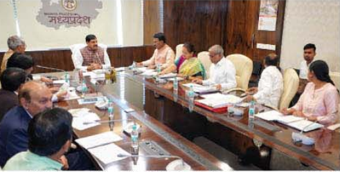
मुख्यमंत्री डॉ. मोहन यादव ने मंत्रालय में ताम्री बैसिन मेगा रीचार्ज एवं कन्हान उप कछार परियोजनाओं के क्रियान्वयन के संबंध में आयोजित बैठक में अधिकारियों को आवश्यक निर्देश दिए

भोपाल, ताम्री बैसिन मेगा रीचार्ज योजना विश्व की सबसे बड़ी ग्राउण्ड रीचार्ज परियोजना है। इस अंतर्राज्यीय संयुक्त परियोजना का अवरोध अमर हो गया है तथा हम शीघ्र ही महाराष्ट्र सरकार के साथ चर्चा कर कारगर करने की ओर बढ़ रहे हैं। जल ही केन्द्रीय जल शक्ति मंत्री और महाराष्ट्र के मुख्यमंत्री को भोपाल आमंत्रित कर कारगर की कार्यवाही की जाएगी। ये बातें मुख्यमंत्री डॉ. मोहन यादव ने मंत्रालय में ताम्री बैसिन मेगा रीचार्ज एवं कन्हान उप कछार परियोजनाओं के क्रियान्वयन के संबंध में आयोजित बैठक में अधिकारियों को आवश्यक निर्देश देते हुए कही। मुख्यमंत्री ने कहा कि इन दोनों ही परियोजनाओं के शीघ्र क्रियान्वयन के लिए हम