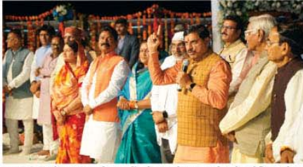
मुख्यमंत्री डॉ. मोहन यादव नर्मदापुरम में नर्मदा प्रकटोत्सव समारोह को संबोधित करते हुए

मुख्यमंत्री ने कहा कि माँ नर्मदा ही एक ऐसी नदी हैं, जिन्की परिक्रमा एक लोग धर्य होते हैं। नर्मदा के जल से मालवा-निमाड़ एवं समूचे नर्मदांचल क्षेत्र के 48 लाख